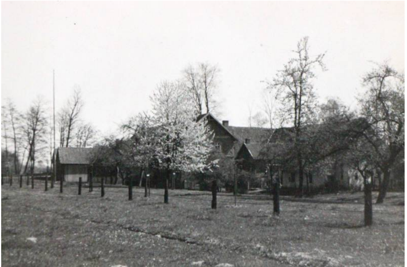
Hier noch 2 besonders idyllische Aufnahmen von Heinrich Baumann aus Werther, der auch einige schöne Oesterweger Motive in den 1930er Jahren geknipst hat.