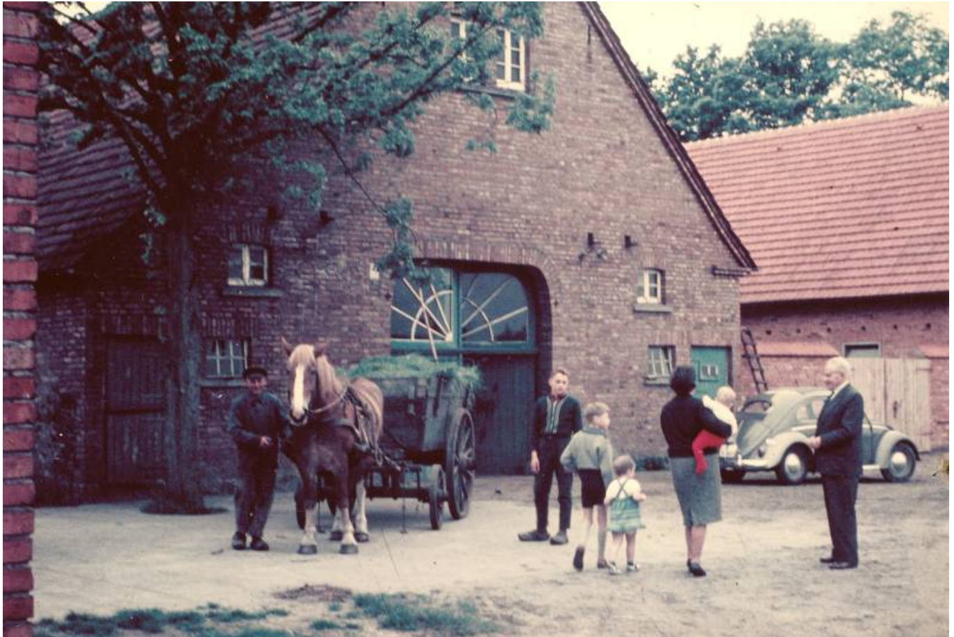
Hofstätte Kampwerth ca. um 1975

Somit war die Sauenhaltung eine Zeitlang das Hauptstandbein des Hofes. Aber auch bei den Kampwerths wird die Landwirtschaft aufgegeben. 2000 kommen die Kühe weg, 2010 die Schweine. Die Ländereien sind jetzt verpachtet.