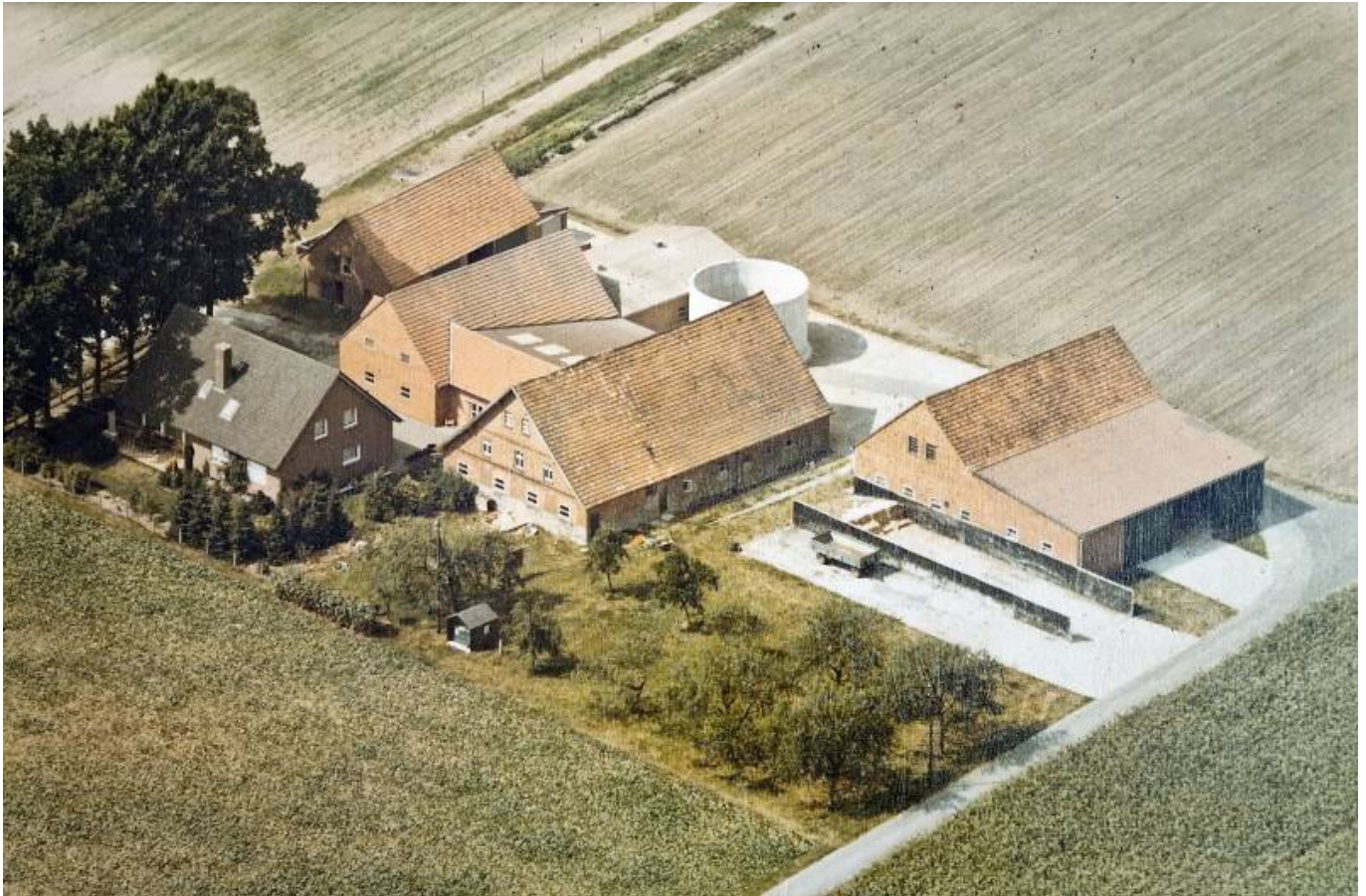
Luftaufnahme des Hofes von 1983