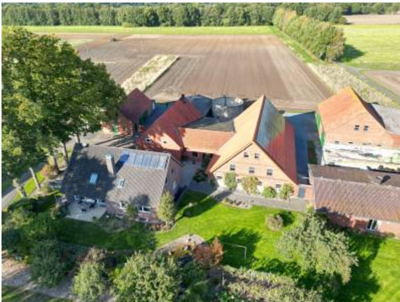
Aktuelle Drohnenaufnahme. Am Ende der nicht gepflügten Ackerfläche hat die alte Hofstätte gestanden