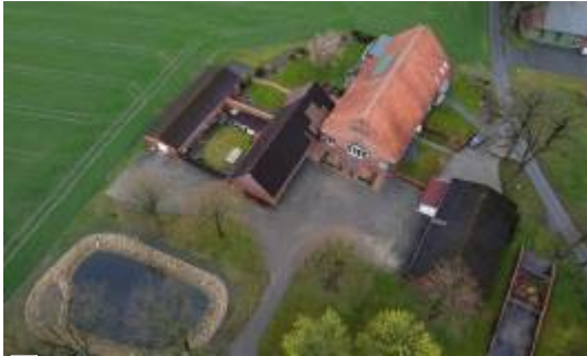
Hof Kruse Luftbild 2022