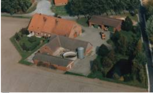
Hof Kruse Luftbild ca. 1980