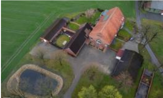
Hof Kruse Luftbild 2022