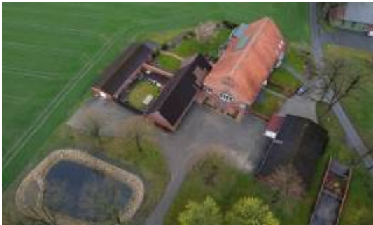
Hof Kruse Luftbild 2022