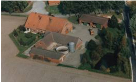
Hof Kruse Luftbild ca. 1980