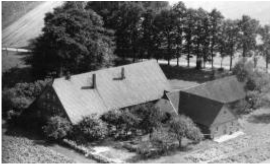
Abb. ##: Hof Kruse Luftbild ca. 1960