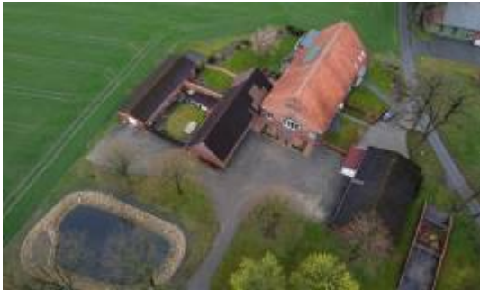
Hof Kruse Luftbild 2022