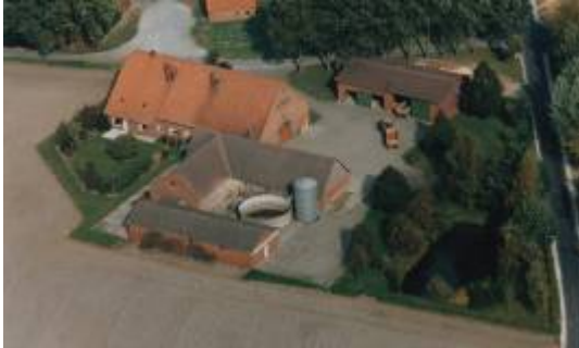
Hof Kruse Luftbild ca. 1980