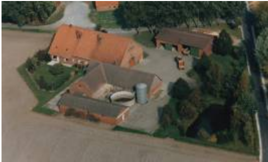
Hof Kruse Luftbild ca. 1980