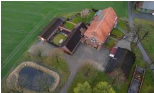
Hof Kruse Luftbild 2022